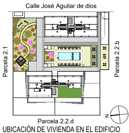
UBICACIÓN DE VIVIENDA EN EL EDIFICIO