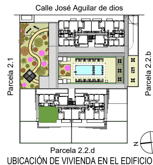
UBICACIÓN DE VIVIENDA EN EL EDIFICIO