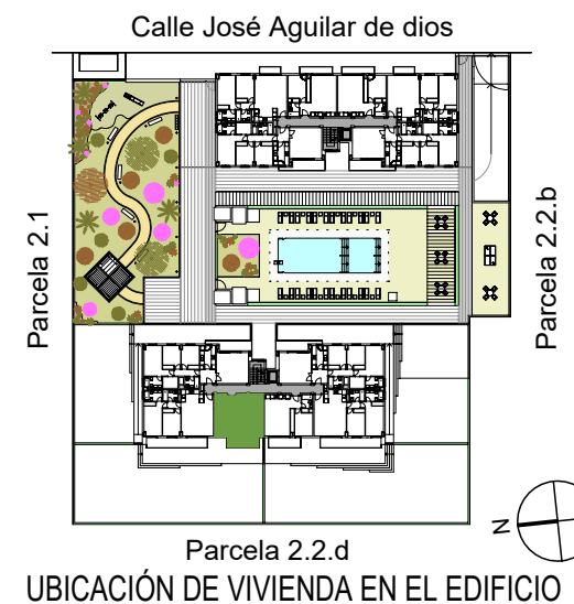
UBICACIÓN DE VIVIENDA EN EL EDIFICIO