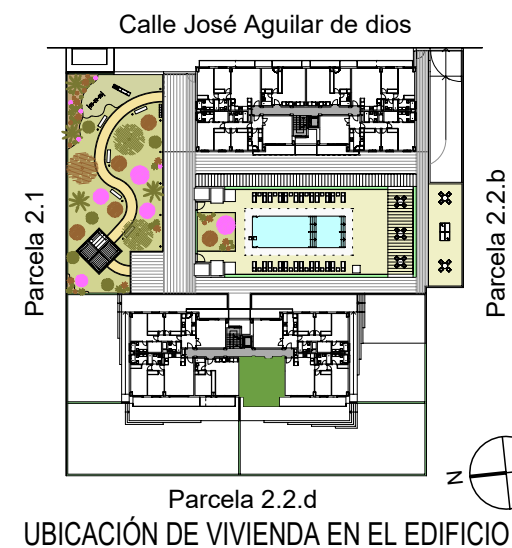
UBICACIÓN DE VIVIENDA EN EL EDIFICIO