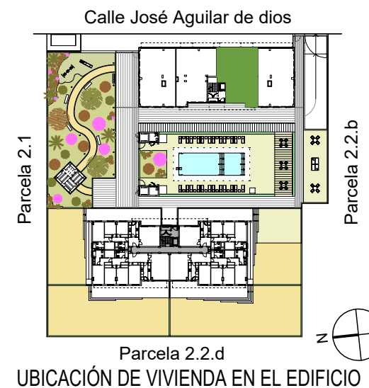
UBICACIÓN DE VIVIENDA EN EL EDIFICIO

Calle José Aguilar de Dios. Parcela 2.2.a del Sector PP.0-5. Córdoba 48 viviendas, garajes, trasteros y piscina