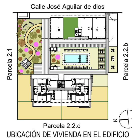
UBICACIÓN DE VIVIENDA EN EL EDIFICIO

Calle José Aguilar de Dios. Parcela 2.2.a del Sector PP.0-5. Córdoba 48 viviendas, garajes, trasteros y piscina