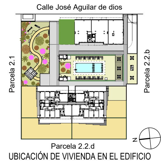
UBICACIÓN DE VIVIENDA EN EL EDIFICIO