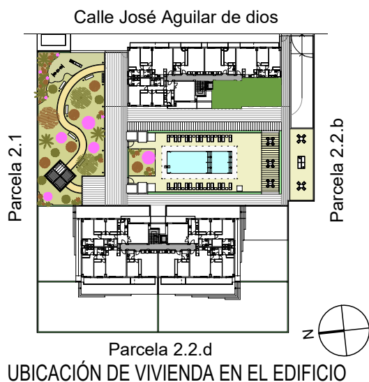
UBICACIÓN DE VIVIENDA EN EL EDIFICIO